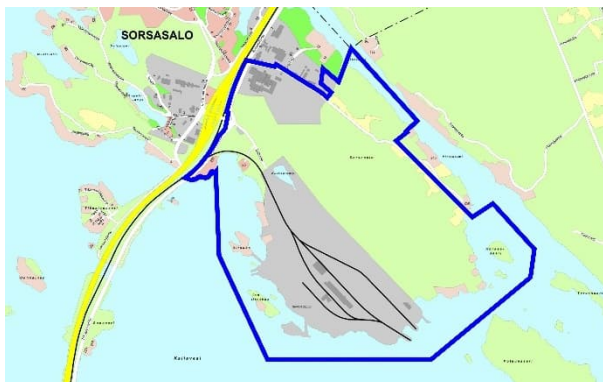
Paveikslas 1. Numatomo detaliojo plano keitimo teritorijos apytikris ribojimas mėlyna linija