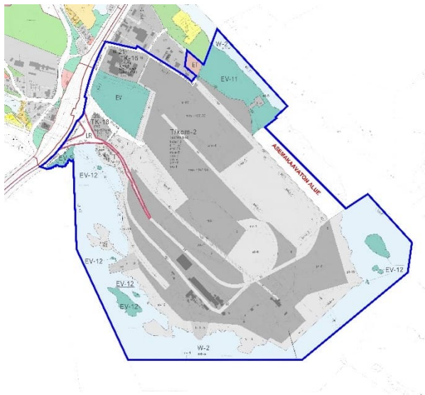
Paveikslas 5. Ištrauka iš galiojančio detaliojo plano

Detaliajame plane taip pat pateikti išsamūs reikalavimai veiklos pobūdžiui skirtingose zonose bei suteikta galimybė įrengti, pavyzdžiui, pramonines geležinkelio linijas.