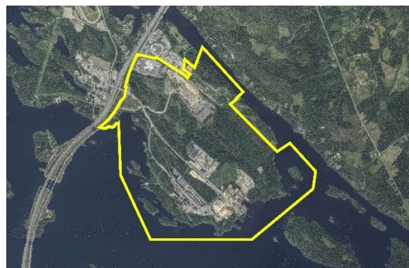
Rysunek 2. Ortofotomapa – obszar zmiany planu zaznaczony żółtą linią.

Czym jest plan uczestnictwa i oceny (OAS)?