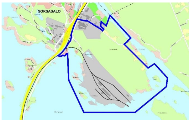
Rysunek 1. Przybliżone granice obszaru zmiany planu zaznaczone niebieską linią.