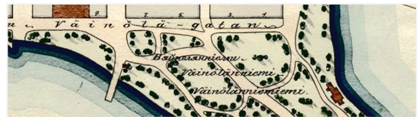
Kuva 5. Ote Kuopion asemakartasta.

Voimassa olevia kaavoja voi tarkastella kaupungin karttapalvelussa kartta.kuopio.fi