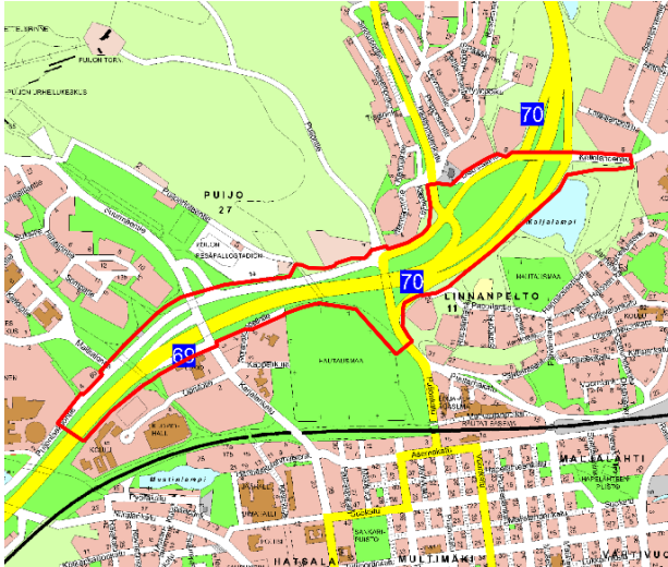
Kuva 1. Kaavamuutosalue on merkitty punaisella viivalla