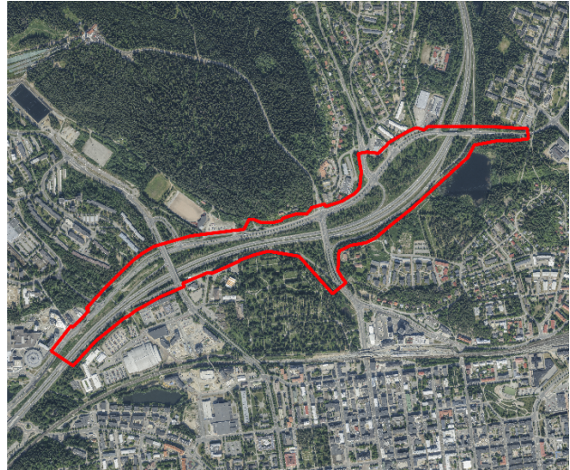
Kuva 2. Ilmakuva, likimääräinen kaavamuutosalue on merkitty punaisella viivalla