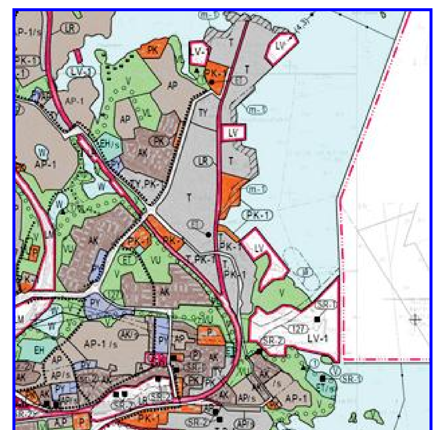
Kuva 2: Keskeisen kaupunkialueen yleiskaava 9.10.2001