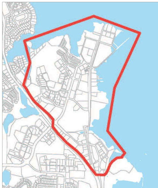
Kuva 1: Osayleiskaava-alueen rajaus.

Kelloniemen osayleiskaavasta tulee oikeusvaikutteinen ja se tulee vahvistuessaan kumoamaan kaava-alueen osalta kaupunginvaltuuston 11.12.2000 hyväksymän Kuopion keskeisen kaupunkialueen yleiskaavan. Laadittavalla osayleiskaavalla ratkaistaan alueen yleispiirteinen maankäyttö ja liittyminen muuhun kaupunkirakenteeseen. Osayleiskaava ohjaa alueen tulevaa asemakaavoitusta ja muuta yksityiskohtaista suunnittelua.