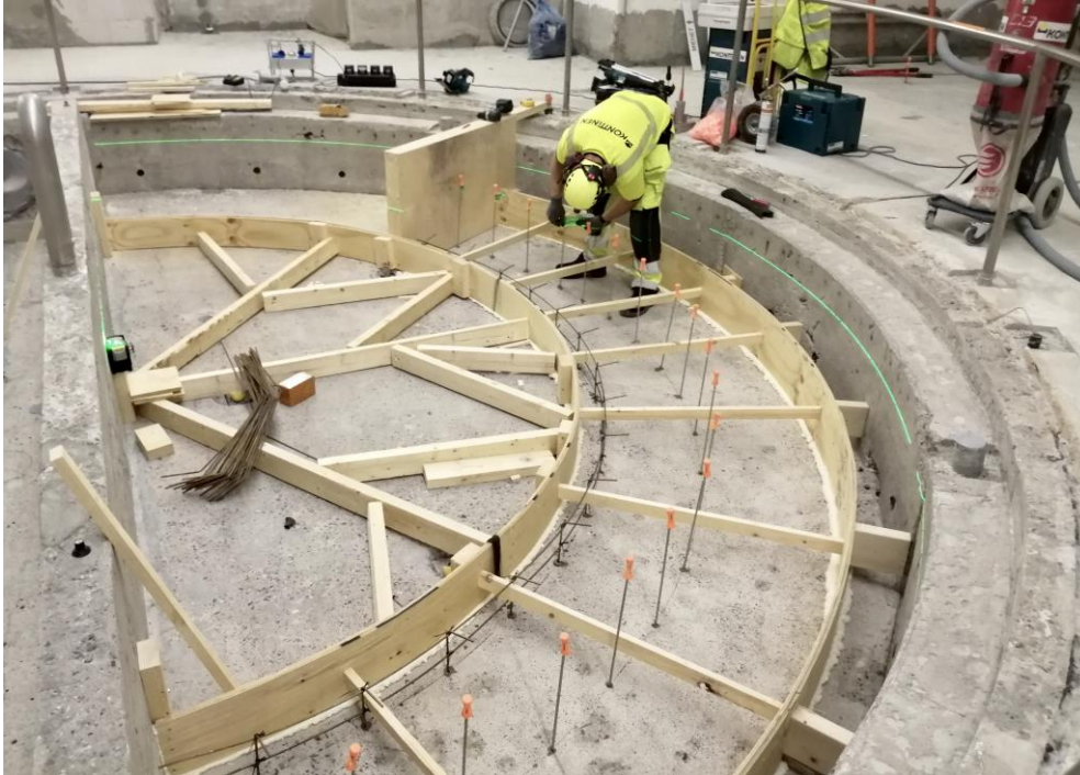
Uimahallin puolella lasten altaan uusien penkkivalujen muottien tekeminen meneillään.