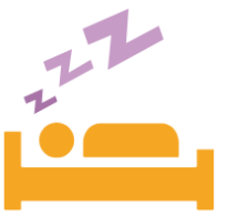
Yöpymiset 2020 -2021 ja tammi-heinäkuu 2022