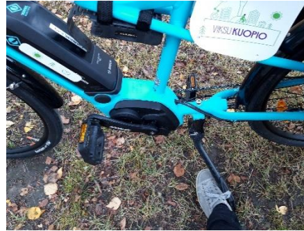
Seisontatueltä poisotto: pidä jalkaa seisontatuen edessä ja työnnä pyörää eteenpäin