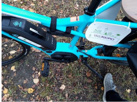
Seisontatuen laitto: paina jalalla seisontatuen takaa ja vedä pyörää taaksepäin