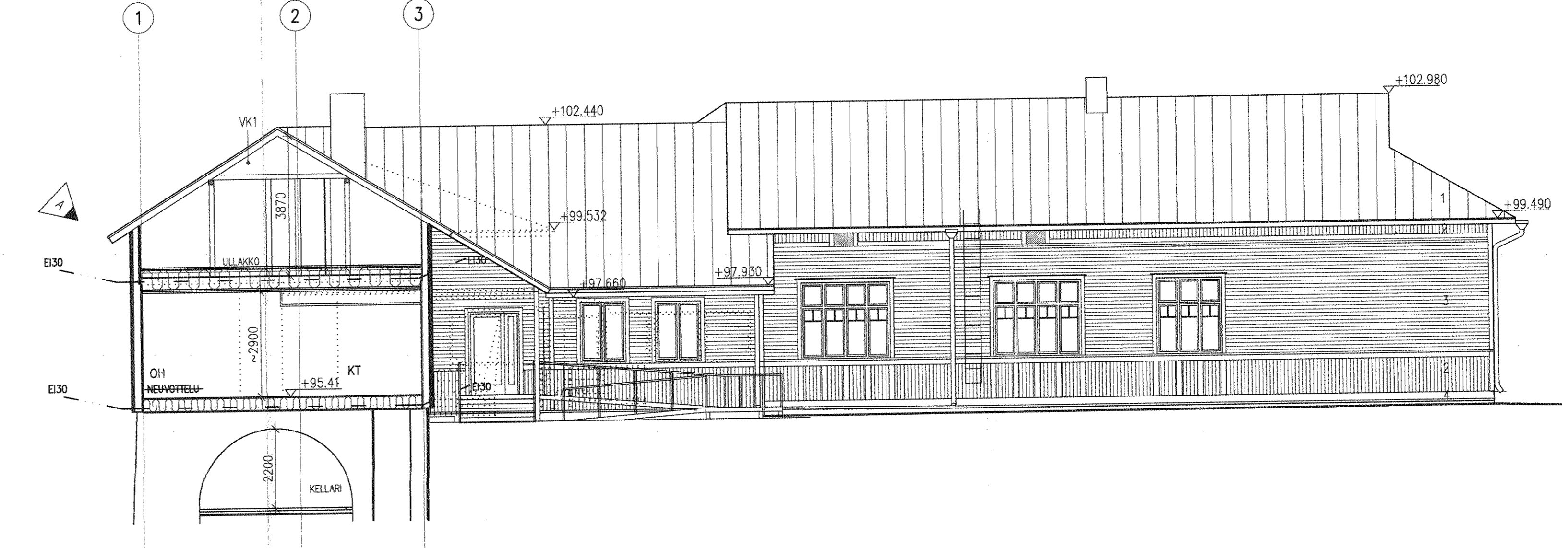
LEIKKAUS C - C